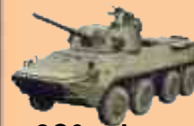
2С9 «Нона СВК»

Артиллерийские подразделения морской пехоты