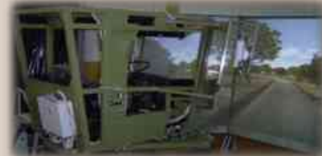
Тренажер вождения 9Ф891