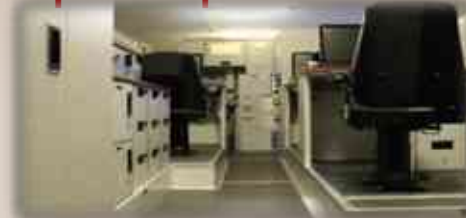
Тренажер КШМ 9Ф886