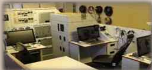
Тренажер ППИ 9Ф885